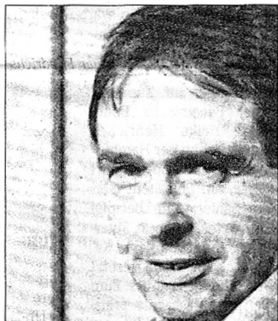
Der fotografierende Soziologe: Pierre Bourdieu

– Centre Culturel Français, bis 28. Mai. Montag bis Donnerstag, 9–17.30 Uhr, Freitag, 9–14 Uhr, Samstag 10–14 Uhr.